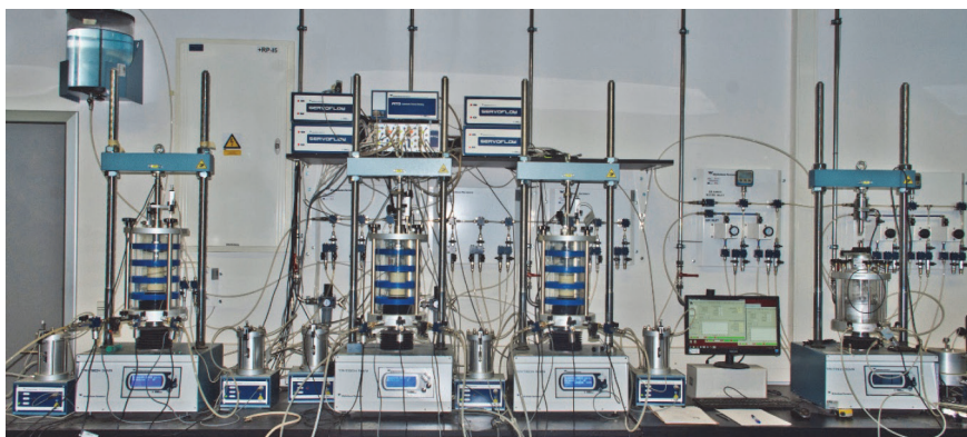
Slika 3. Sustav za troosno ispitivanje uzoraka tla

Uređaj DCTRIAX ima mogućnosti statićkog i dinamićkog ispitivanja uzoraka tla, gdje se dinamićki utjecaji mogu definirati na različite načine (sinusoidni, trokutasti, trapezoidni oblik funkcije opterećenja, ili pak zapis akceleracije od potresa). RC uređaj je sada vrlo rijedak kao oprema u geotehničkim laboratorijima u regiji i vjerojatno jedini na širem području, te ima mogućnost kontinuirane promjene frekvencije pomoću RC CHIRP postupka, [2].