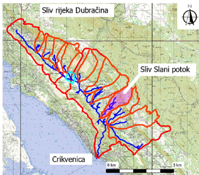
Slika 1. Situacijski prikaz Slanog potoka na topografskoj podlozi [28]

Sliv Slanog potoka je povijesno prepoznati prostor pod utjecajem štetnih pojava prouzročenih djelovanjem vode, što je dugogodišnji i kompleksan problem. Upravo zbog toga to područje već cijeli niz godina privlači mnoge istraživače, koji svojim raznolikim pristupima pridonose boljem shvaćanju procesa koji se odvijaju na tom području, rezultat čega je niz objavljenih znanstvenih radova. Za ovo su istraživanje značajni radovi Benca i sur. [29], u kojemu se objašnjava proces ekscesivne erozije, Aljinovića i sur. [30], u kojemu je opisana geološka struktura te procesi nastanka erozije na slivu Slanog potoka, Ružića i sur. [31], u čijem su radu analizirana otjecanja sa sliva Slanog potoka i izvora rijeke Dubračine, rad Sušanj i sur. [32], koji izrađuju bazu podataka stanja vodotoka na području Vinodolske doline te, naposljetku, doktorski rad [28], u kojemu su detaljno istraženi procesi otjecanja uz razvoj hidrološkog modela otjecanja.