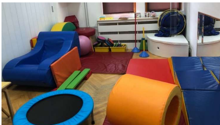
Slika 18: Soba za fizioterapiju

pomagala) provodi program za djecu s motoričkim teškoćama i fizičkim invaliditetom, dok se u vrtiću Maestral pretežito nalaze djeca s poremećajem iz spektra autizma. Na ulazima u oba vrtića nalaze se rampe i rukohvati u više razina, a ulazna vrata su klizna čime je riješena moguća arhitektonska barijera. U vrtićima su prostorije dnevnog boravka organizirane u centre aktivnosti i prilagođene svakom djetetu, od građevnog, stolno-manipulativnog, obiteljskog nadalje i po potrebi se stvaraju novi centri prema interesima djece. U vrtiću Krnjevo se također nalazi i prostorija za fizioterapiju koja je opremljena potrebnom opremom za vježbanje. Također sobe imaju rukohvate koji pomažu djeci koja tek uče hodati da se mogu kretati po cijelom prostoru. U vrtiću Maestral su ponajviše prilagođeni elementi namještaja, stolovi i stolice, didaktični materijali. Sve sanitarne prostorije su klasičnog dizajnirane i smještene na prikladnim mjestima jer im se može jednostavno pristupiti iz svih prostorija u vrtiću, jednako kao iz dvorišta. Oba vrtića imaju natkrivenu terasu i vanjski dvorišni dio za igru i učenje u koji može pristupiti svako dijete korištenjem prijelaznih rampi i rukohvata. Veliki vanjski prostori prekriveni betonom i travom služe za igru djece, a opremljeni su s ljuljačkama, klackalicama, toboganima i sl., elementi za igru su prilagođeni za svu djecu, osim za onu koja koriste invalidska kolica.