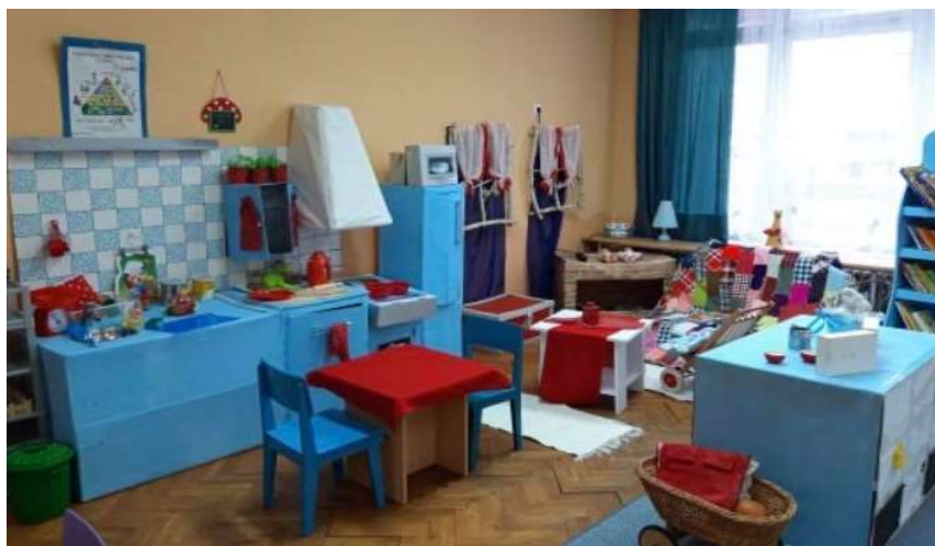
Slika 21: Unutrašnji prostori dnevnog boravka.

klasičnih prostorija u vrtiću, u sklopu vrtića Kosjenka postoji senzorna soba koja je namijenjena djeci kojoj je potrebna senzorna integracija radi problema s motorikom i autizmom, ali ju mogu koristiti i djeca bez poteškoća. Soba je opremljena raznolikim strunjačama, švedskim ljestvama, rekvizitima za održavanje ravnoteže (trampolin, ljevak...), bazenom s lopticama i raznolikim taktilnim pločama. Problematični dijelovi u vrtiću se odnose na prijelazne elementa između prostorija i na vanjski prostor, a odnose se na djecu koja koriste invalidska kolica. Djeca koja koriste kolica nemaju samostalan pristup vanjskom djelu, već im je potrebna pomoć odrasle osobe koja će kolica prevesti preko pragova prilikom izlaska na dvorište ili terasu. Vrtić ima prostrano dvorište prekriveno zelenom travnatom površinom koje je sa svih strana ograđeno te terasu koja se prostire duž cijelog vrtića, a prekrivena je betonskom podlogom.