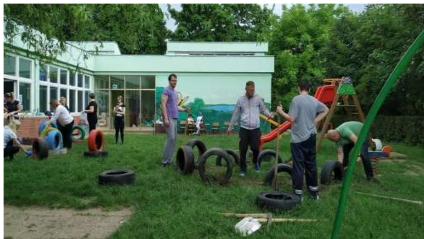
Slika 22: Vanjski dio dvorišnog prostora vrtića [37]