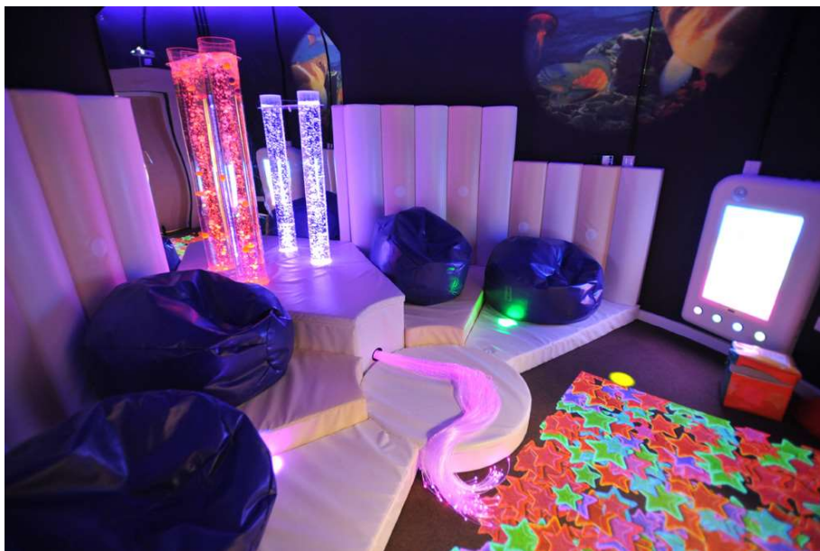
Slika 16: Snoezelen tip senzorne sobe [32]

Postoje mnogi slučajevi diljem svijeta, a tako i iz Hrvatske gdje se terapija u senzornim sobama pokazala izuzetno uspješnom i efikasnom. Mnoga djeca koja su imala problema sa poremećajem sensorike i govora, nakon samo nekoliko mjeseci terapije i odlaženja u senzorne sobe postižu nevjerojatne napretke, razvijaju govor, povećava im se koncentracija i dr., ali najvažnija stvar pri kvalitetnom radu, razvoju i ozdravljenju je intervencija na vrijeme i pristup senzornom tipu terapije koji može imati samo pozitivne učinke na dijete.