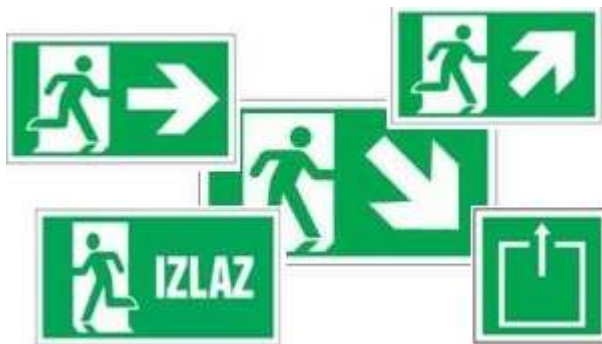
Slika 2: Znakovi kretanja unutar zgrade [9]

Obična rješenja koja su pružaju pristup i korištenje svim grupama ljudi čine jednostavnost uporabe. Treba izbjegavati složenost i specijalizirana rješenja. Glavni pristup i ulaz zgradi trebali bi biti jasno naglašeni kako bi se jednostavno pronašli i koristili. Dizala, stubišta, toaleti, informacije i ostali elementi trebaju se lako pronaći i biti na mjestima logične pretpostavke. Obrasci kretanja unutar zgrade trebaju biti prirodni i logični, sukladno tome alternative također trebaju biti jasno označene. Znakovi trebaju biti izrađeni od jednostavnih, jasnih i dobro poznatih simbola, a na javnim ustanovama i zgradama, također s opcijom korištenja taktilnim znakovima i zvučnom signalizacijom.