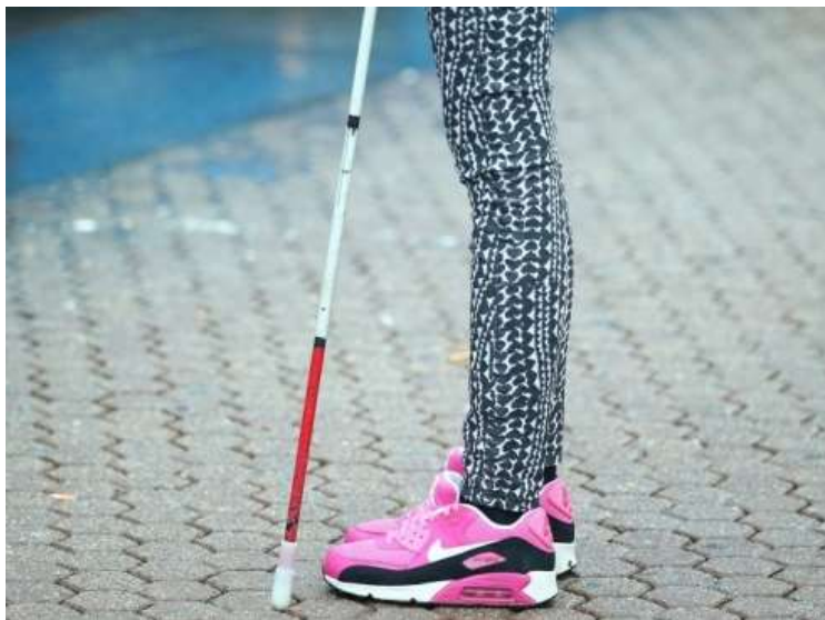
Slika 10: Kretanje djeteta uz pomoć bijelog štapa [22]

Sljepoća je oblik teške invalidnosti, a njome se smatra oštećenje vida dovodi po potpunog gubitka vida, bez postojanja vizualnih podražaja. Slijepice osobe se dijele u dvije skupine: one osobe koje su kongenitalno slijepice, od rođenja i one koje su oslijepile naknadno u životu. Glavne bolesti i oblici koji uzrokuju sljepoću su: kratkovidnost, dijabetička retinopatija i glaukom. Iako sljepoća nije toliko zastupljena kod djece, vrtići koji su prilagođeni za djecu s posebnim potrebama ne smiju zanemarivati djecu koja imaju problema s vidom. U Hrvatskoj trenutno ima 212 slijepice djece u dobi do 16 godina od kojih je 84 od njih slijepo zbog razvoja prematurne retinopatije. [23] Postoji veliki broj fizičkih prepreka na koje slijepice osobe nailaze svakog dana, jednako tako i djeca kojoj je potrebno osigurati okoliš i prostor sigurnim za normalno funkcioniranje života. Potrebno je prilagoditi prostore vrtića i slijepoj djeci omogućiti interakciju s ostalom djecom. Pri kretanju slijepih osoba koriste se razna pomagala, ali je najzastupljenija uporaba bijelog štapa. Ovisno o prostoru i okruženju kojem se slijepice osobe kreću tako postoje i različite tehnike kretanja, kretanje u zatvorenom prostoru i kretanju u vanjskom prostoru. Kod uporabe štapa jedna je metoda i ta se koristi jednako u svim okruženjima i prostorima, a to je metoda dodira, gdje dijete štapom ispred sebe ispituje teren kojem korača i prilazi.