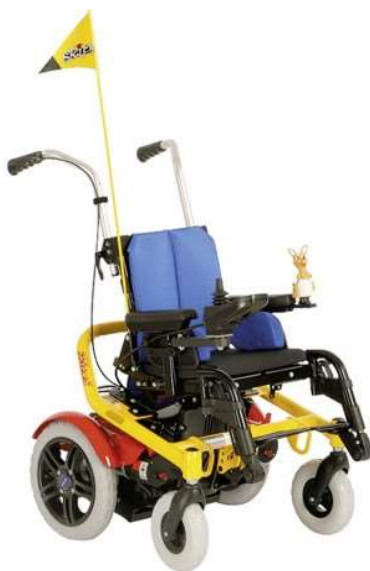
Slika 6: Elektromotorna dječja kolica [17]