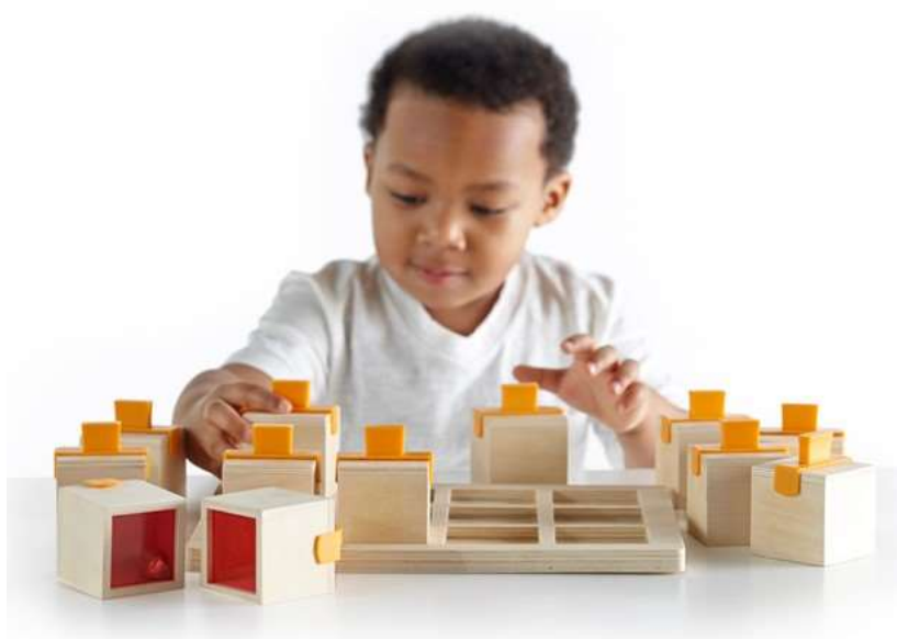
Slika 14: Igra zvučnim kockama koja razvija slušnu percepciju [29]

Još jedan primjer slagalice koje ne izostavlja djecu koju su slabovidna je upravo igra s dominom. Na klasične domino pločice dovoljno je samo još staviti brailleovo pismo i tada se tim dominom mogu koristiti sva djeca u vrtiću. Obilje raznih sredstava i modeliranje istih pripomaže razvijanju djetetove kreativnosti i mašte i pospješuje učvršćivanju djetetovih mentalnih vještina. Ploče s magnetima i raznim bojama također pospješuju razlikovanje oblika, boja i površina igraćih elemenata. Primjerice, didaktička ploča sa šupljim zvučnim kockama s kuglicama unutar pospješuje rad slušnih organa kod djece s teškoćama u razvoju kojima je teško savladati govorne ili slušne vještine. Slušna percepcija spada u jednu od pet osnovnih percepcija. To je mogućnost predodžbe zvučnih signala pomoću vibracija osjetila, koje prima organ uha. Za razvoj govornih vještina, za učenje i razmišljanje dobre slušne vještine su od značajne važnosti.