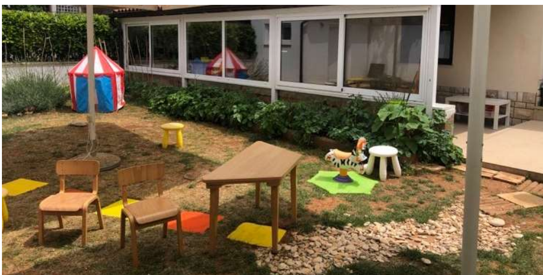
Slika 28: Vanjski dvorišni dio vrtića