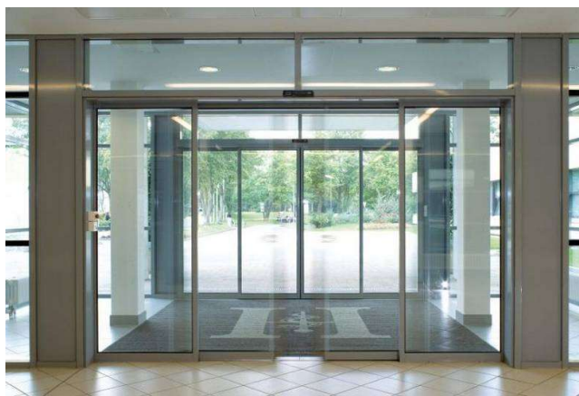
Slika 3: Automatska vrata s otvaranjem na senzor [10]

Ulaz i upotreba zgrade trebaju biti osmišljeni za korištenje od strane svih grupa korisnika, što podrazumijeva eliminaciju rješenja koja zahtijevaju potpunu pokretljivost, veliku snagu i veličinu koja su prilagođena samo osobama koje hodaju ili stoje ili osoba s normalnom brzinom kretanja. Primjeri za to su blagi uvjeti penjanja, rampe s blagim padinama, ulazi bez stepenica, rukohvati s drškama u više razina, vrata koja se lako otvaraju ili automatsko otvaranje vrata na senzor.