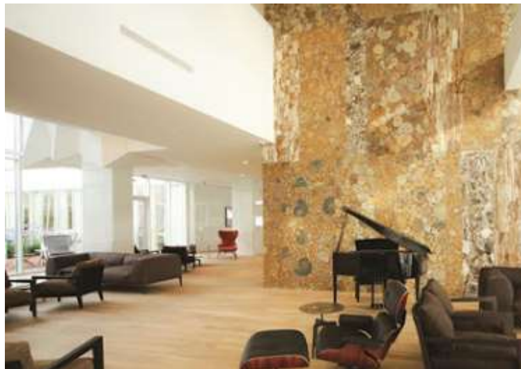
Slika 5: Ventilacija kao sastavni dio ugodnog okruženja [12]

Korištenje materijala koji ne štete okolišu, izbjegavanje onih materijala koji mogu izazvati alergijske reakcije. Izbjegavanje tepiha, materijala i elemenata koji skupljaju prašinu. Kontinuirano vođenje računa o planovima za efikasne mogućnosti čišćenja zgrade. Ispravno provedena i dimenzionirana ventilacija i organiziran stručan nadzor nad sustavom ventilacije.