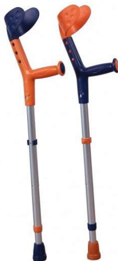
Slika 11: Štaka za hodanje [24]

Djeca koja se kreću uporabom štaka imaju u pravilu samo privremene potrebe radi medicinskog stanja. Najčešće ih koriste zbog trenutne povrede nogu, kao što su ulegnuće, uganuće, napuknuće i lom kostiju što im onemogućava normalno hodanje. Korištenje štaka također može biti u prijelaznom razdoblju razvoja djeteta. Dijete može koristiti štaka prilikom otkrivanja smetnji u razvoju kada mu se postepeno oslabljuje mogućnost oslonca na noge, ali jednako tako dijete može koristiti štaka ako mu razvoj napreduje te se medicinski gledano stanje poboljšava te se s nekih drugih alata kretanja prebacuje na štaka koje mu isto s vremenom ne moraju biti potrebne. Za štaka se zaključno može reći da su prijelazno pomagalo, a kao konstantno pomagalo su zastupljenije kod osoba starije dobi od dječje. Štaka se mogu podijeliti u svije skupine. Jedna vrsta štaka je ona koja ima mekani podložak, jastučić prvi vrhu koji bi trebao biti smješten ispod pazušnog dijela, uz to ima i kraći podlaktični dio koji prenosi težinu gornjeg dijela tijela i ruke. Druga vrsta omogućava stabilnost podlaktice i lakta, a uključeni dijelovi su: uspravni dio, čašicu za oslanjanje i ručku za zahvaćanje na nižoj razini. Obje vrste štaka imaju male klinove i rupice koje služe za prilagođavanje visine štaka kako bi odgovarala što većem broju osoba.