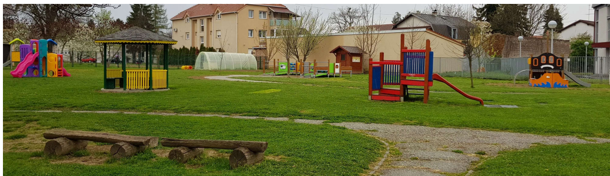
Slika 25: Vanjski dvorišni prostor vrtića [38]

Vrtić ima velika dvorišta koja zadovoljavaju sve standarde. Na dvorištu je travnata površina, oko sprava su sigurnosne ploče i puteljci su popločeni betonskim pločama u svim objektima. U dvorišnom djelu vrtića nalaze se sprave koje su prilagođene djeci s teškoćama. Neke sprave imaju pristupne rampe prilagođene djeci koja se kreću pomoću invalidskih kolica, povišene pješčanike u kojima se može igrati dijete s teškoćama u razvoju, odnosno u invalidskim kolicima. U neposrednoj blizini sprava postoje i rukohvati, ali po ostatku dvorišta rukohvata nema. Dijete u kolicima ima mogućnost pristupa svakom djelu igrališta i dvorišta, ali nema mogućnost uporabe svih sprava na igralištu. Vrtić ima u planu uređenje vanjskog i unutarnjeg prostora treba nadograđivati i unapređivati ovisno o vremenu i kapitalu. Kako bi se što kvalitetnije iskoristio prostor u planu je još ugraditi rukohvate i po ostatku dvorišta i u svim unutarnjim prostorijama, izgraditi sanitarni čvor prilagođen djeci s teškoćama u razvoju, odnosno djeci koja koriste invalidska kolica.