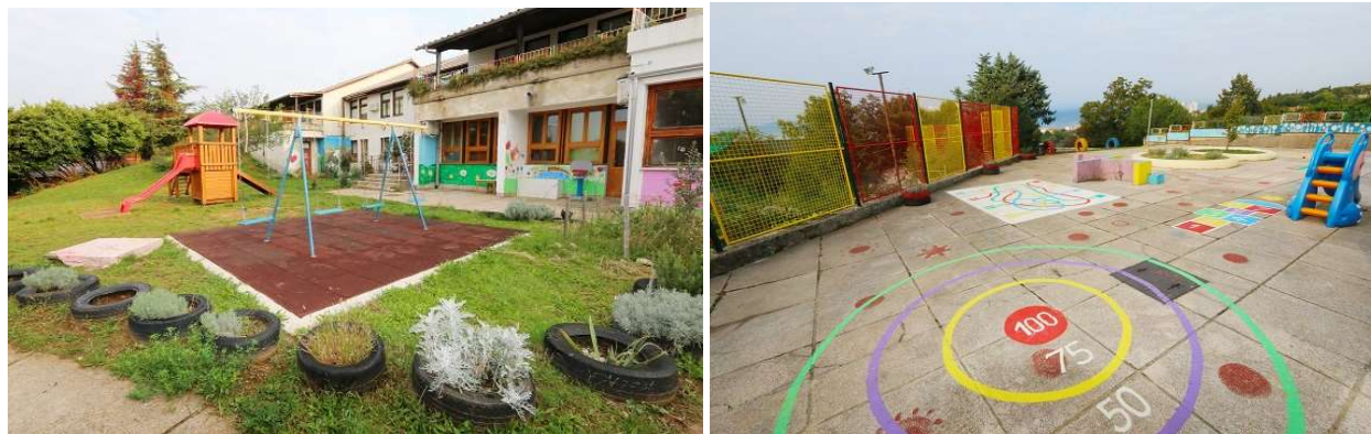
Slike 19, 20: Vanjski dvorišni prostor vrtića [36]

bi trebao imati više sadržaja, sprava (ljuljačke, tobogani) za djecu koja koriste invalidska kolica jer taj dio nije planiran kada je vrtić građen, za djecu s drugim teškoćama su sprave prilagođene.