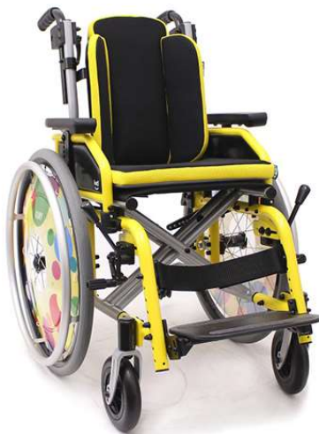
Slika 7: Klasična invalidska kolica [19]

Klasična invalidska kolica su jednostavnijeg mehanizma nego motorna kolica, a njima se koriste djeca koja gornjim udovima mogu samostalno upravljati kolicima uz pomoć okretanja kotača. Zahtjevi kod klasičnih kolica su manji u usporedbi s motornim kolicima jer djeca koja koriste klasični tip imaju različite zahtjeve u odnosu na djecu koja koriste motorna kolica. Ovisno o proizvođaču dizajn kolica se može mijenjati izborom kotača, sjedala i naslonjača u raznim bojama i formatima.