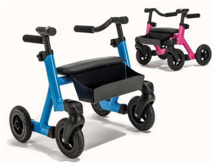
Slika 9: Rolator sa četiri kotača [21]

Postoje jednostavniji i složeniji oblici hodalica. Neke hodalice nemaju kotače, neke imaju pomoćna dva, tri kotača ili se pak oslanjaju isključivo na kotače. Ovisno o proizvođaču postoje i široki rasponi nadogradnji i mehanizama na hodalicama s ciljem jednostavnije i boljeg kretanja. Dječje hodalice su u pravilu prilagođene za djecu koja se mogu osloniti na noge, ali imaju problema s održavanjem stabilnosti cijelog trupa, te im upravo hodalice omogućuju samostalno kretanje vlastitog tijela, ali i oslonac. Djeci je korištenjem hodalice pruženo hodanje s maksimalnom sigurnošću što dovodi do glavnog cilja stjecanja potpore prilikom hoda djeteta. Velik broj hodalica omogućuje jednostavno rukovanje i sklapanje i korištenje takvog dizajna pruža djeci stabilnost i sigurnost koja im je potrebna za svakodnevne aktivnosti. Postoje razni tipovi hodalica, od onih jednostavnih i bazičnih do hodalica koje imaju kočnice, mjesto sa sjedalom i kotačima. Bazične hodalice se sa svakim korakom podižu i spuštaju zato što nemaju kotače već su noge od hodalice postavljene na gumenim čepovima, a složenije hodalice imaju sjedalo pri čijem korištenju mora biti osigurana i kočnica na kotačima kako bi se blokirala hodalica prije sjedenja. Također je česta primjena modela hodalice koji već ima ugrađenu abdukcijsku sjedalicu tzv. gaće u koje se postavi dijete te se laganim koračanjem pokreće, a prilikom kretanja dodatno je osiguran držačem bokova i držačem pazuha.