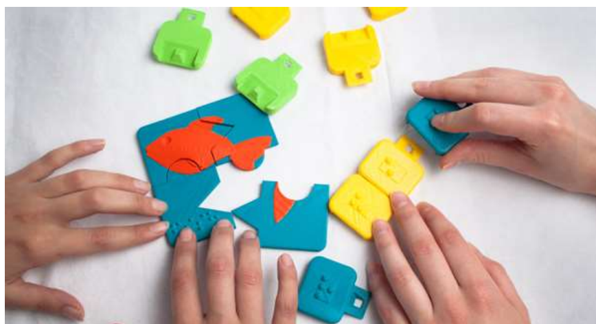
Slika 13: Oblik taktilne 3D slagalice prikladne za slabovidnu djecu [28]