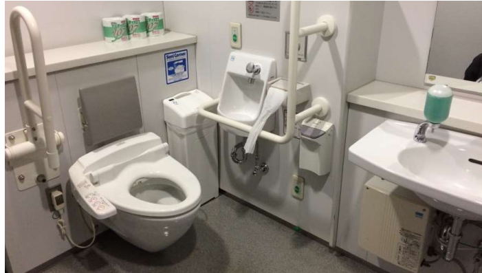
Slika 4: Toalet za osobe s invaliditetom [11]