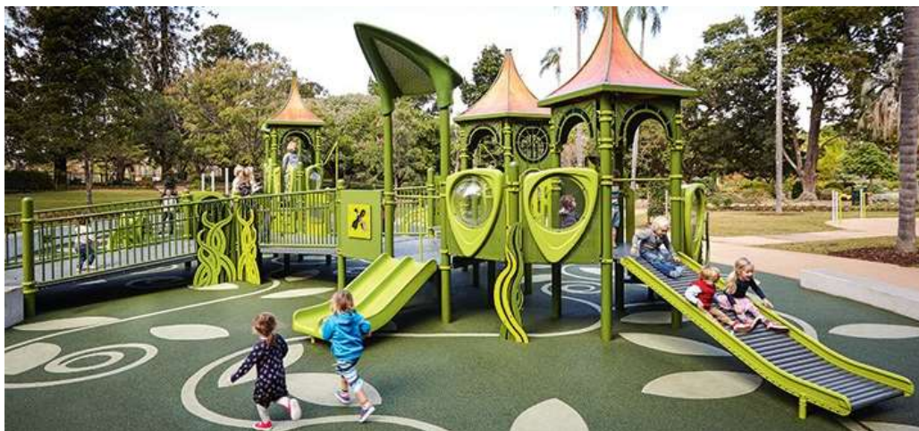
Slika 17: Inkluzivni tip igrališta [33]