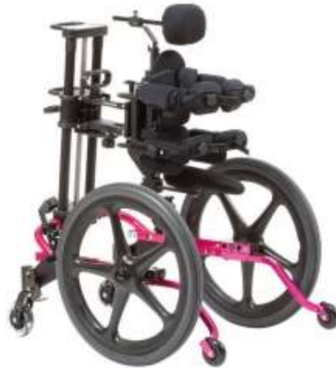
Slika 8: Dinamičko pomagalo [20]

Dinamička pomagala za hodanje ovog tipa (vidi sliku gore) pretežito se koriste kada dijete pati od zakašnjelog ili nepravilnog razvoja koje je dovelo do narušavanja sposobnosti hodanja i u nekim slučajevima do nepravilne formacije kostiju, a dijete koje koristi ovakav tip pomagala vrlo vjerojatno ima problem formacije kostiju kukova i zdjelice. Ovakav konceptni mehanizam potiče normalni motorički razvoj djeteta ,a jednako tako mu i pruža mogućnost igre s ostalom djecom i kretanje bez tuđe pomoći. Ovakav model pomagala pruža djetetu stabilnu potporu predjela kukova, zdjelice i trupa općenito te mu omogućuje hodanje-kretanje u razini očiju s ostalom djecom. Funkcijska jedinica za dinamičko pozicioniranje podupire razvoj prirodnog obrasca hoda koji pridonosi napretku pri djetetovu razvoju i poboljšava stanje mobilnosti.