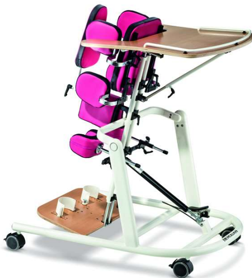
Slika 12: Stajalica s terapijskim stolom [25]

Kada je u pitanju razvoj djece sustavi za pomoć pri samostalnom stajanju i pomagala za kretanje su od ključne važnosti jer im ti elementi pomažu fizički sudjelovati u elementima svakodnevnog života. Prije nego što dijete napuni 18 mjeseci života vrlo je važno obratiti pozornost na stajanje, pa čak i uz potporu kako bi se spriječile moguće fizičke posljedice. Pravovremeno razvijanje sposobnosti stajanja pruža kuku mogućnost pravilnog razvijanja, a to sprečava moguće buduće ortopedske probleme. Korištenjem stajalica djeca koje ne nauče samostalno stajati mogu napredovati. Stajalice kao medicinsko pomagalo mogu se pojaviti u raznim oblicima, stajalice s terapijskim stolom, okviri za stajanje i pronacijske-supinacijske stajalice. Modeli stajalica slični su nekim modelima hodalice međutim glavna je razlika u tome što se dijete u stajalici ne može samostalno kretati već mu je potrebna konstanta tuđa pomoć. Ovakav tip stajalice (vidi sliku gore) je moguće individualno prilagoditi potrebama svakog korisnika. To je pronacijska stajalica koja ima prednju prilagodbu tijelu korisnika. Potpore za stopala, koljena, zdjelicu i trup podesive su po visini dubini i kutu. Omogućava stabilnost, novu i drugačiju percepciju okoline, selektivno istraživanje, učenje i sudjelovanje u svakodnevnim aktivnostima na novi način. Ovakav sustav medicinskog pomagala ima glavnu zadaću osiguranja ispravnog načina potpore djetetu i pomaganje djetetu u interakciji s okolinom.