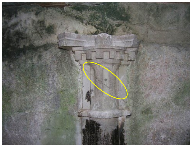
Slika 1. Kapitel stupa s označenom pukotinom

Ukoliko bi do sloma kamenog kapitela došlo nakon sanacije, šteta bi bila velika jer bi istovremeno moglo doći do pomaka čelične (i staklene) konstrukcije nad njim, a zamjena kapitela nakon što je konstrukcija nad njim već izvedena bila bi iznimno složena.