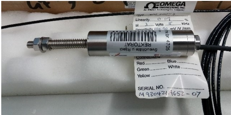
Slika 3. AC LVDT s nominalnim hodom \pm 5 mm