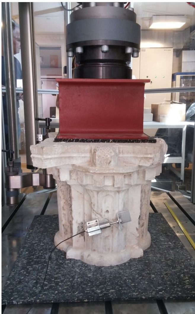
Slika 5. Kapitel stupa u kidalici

Tlačno ispitivanja je prekinuto kada je na mjernoj ćeliji očitana sila od 50 kN. Nije došlo do širenja postojećih pukotina pa se je tlačno ispitivanje moglo provesti do tražene vrijednosti sile od 50 kN. Na kidalici su mjerene tri veličine: sila na mjernoj ćeliji, pomak pomične grede i vrijeme ispitivanja.