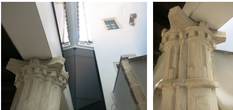
Slika 8. Kapitel stupa nakon sanacije [10]