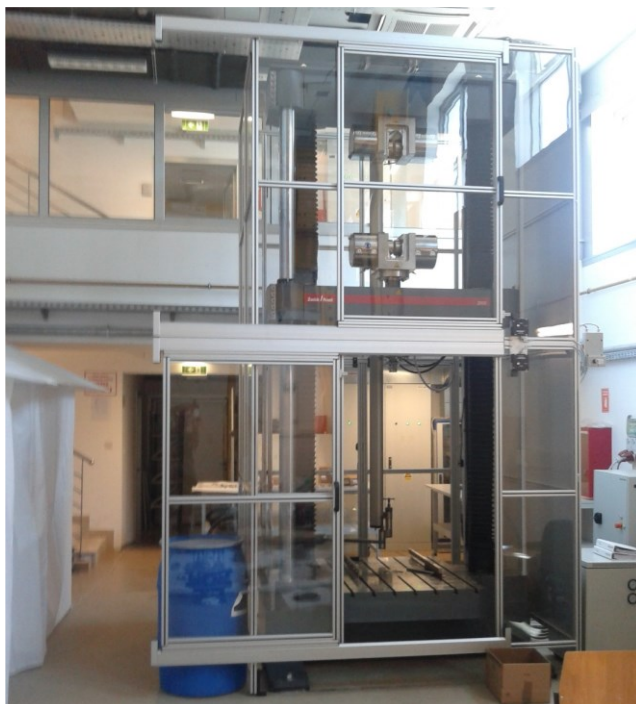
Slika 2. Univerzalni tlačno-vlačni stroj za ispitivanje (kidalica)