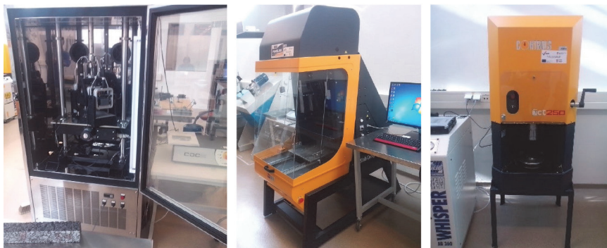
Slika 1. Uređaj za ispitivanje krutosti i zamora; valjkasti i kružni zbijrač

S obzirom na to da Laboratorij raspolaže i opremom empirijskog pristupa, mogu se istražiti korelacije koje bi povezujući dva pristupa pokušale iskoristiti dosadašnja pozitivna iskustva u proizvodnji i ugradnji asfaltnih mješavina. Prikupljeni podaci bit će značajna pomoć kvalitetnijem određivanju uvjeta u budućim tehničkim propisima kako na lokalnoj tako i na državnoj razini. Time će se unaprijediti trajnosti i služnosti cesta te konkurentnosti cestograđevnog sektora.