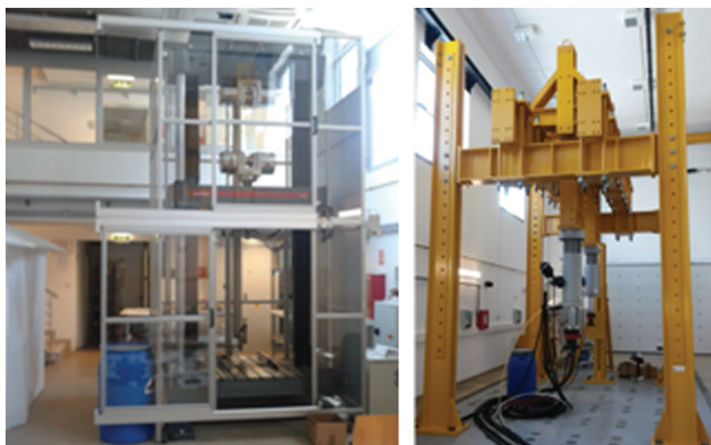
Slika 4. Kapitalna oprema laboratorija za konstrukcije: a) kidalica i b) kruti čelični okvir s dva aktuatora

Čest problem dinamičkih ispitivanja je način praćenja odaziva modela na dinamičku pobudu. Sustav kamera i programa za obradu podataka za 3D beskontaktno optičko mjerenje pomaka i deformacija GOM Aramis/Pontos omogućuje praćenje cijelog tijeka ispitivanja bez promjene geometrije i mase modela. GOM sustav se sastoji od dvije brze kamere, od kojih svaka ima mogućnost snimanja do 168 fps rezolucijom od 2400x1728 piksela te do 1300 fps rezolucijom od 2400x168 piksela. Nakon početne kalibracije, kamere snimaju cijeli tijek eksperimenta i na temelju praćenja površine ispitivanog modela, koja prethodno mora biti adekvatno obrađena, kao rezultat daju podatke o položaju točaka na površini modela. Iz dobivenih sirovih rezultata je moguće pratiti deformacije na površini modela (Aramis) ili brzine i ubrzanja (Pontos). Dva seta leća omogućavaju snimanje mjernih volumena od 25x18mm 2 do 230x170 mm 2 (leće 50 mm) te od 125x90 mm 2 do 2150x1600 mm 2 (leće 20 mm).