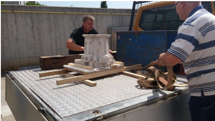
Slika 4. Transport kapitelu stupa

Zbog stanja kapitelu stupa posebna se pažnja posvetila transportu kapitelu stupa iz palače Moise u Cresu u prostorije Laboratorija za konstrukciju Građevinskog fakulteta u Rijeci (Slika 4.), gdje je provedeno ispitivanje dana 31. kolovoza 2017. godine.