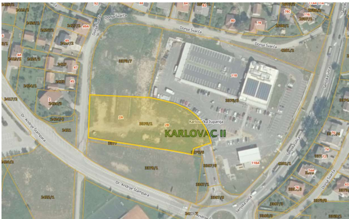
Lokacija parcele 3376/1; izvod iz katastra

Nasuprot ulice dr. Andrije Štampara, koja vodi do Opće bolnice udaljene 300 metara, nalazi se tenisko igralište te još jedna benzinska postaja. Ostali popratni sadržaji neophodni za život u vidu škole, vrtića, ugostiteljskih objekata, trgovina i sl. nalaze se u krugu jednog kilometra. Lokacija čestice je dosta frekventna jer se nalazi u neposrednoj blizini senjske ulice koja se nadovezuje na staru cestu Lujziju. Zbog toga moguće je da će se javljati problemi prilikom vanjskog transporta, stoga je bitno isplanirati pristupačan i funkcionalan ulaz i izlaz sa gradilišta za sva vozila koja će pristupati gradilištu. Prometna povezanost je dovoljno dobra stoga neće biti potrebe za mijenjanjem postojeće regulacije prometa niti za zatvaranjem neke od prometnica. Na lokaciji predmetne čestice u prošlosti nalazila se vojarna, pomno odabrana pozicija iz razloga što je teren na uzvisini te pruža dobar pogled na većinu grada. Samim time obje zgrade imati će odličan pogled na grad, a i okolicu.