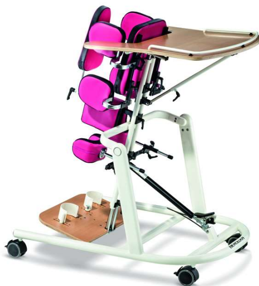
Slika 12: Stajalica s terapijskim stolom [25]

Kada je u pitanju razvoj djece sustavi za pomoć pri samostalnom stajanju i pomagala za kretanje su od ključne važnosti jer im ti elementi pomažu fizički sudjelovati u elementima svakodnevnog života. Prije nego što dijete napuni 18 mjeseci života vrlo je važno obratiti pozornost na stajanje, pa čak i uz potporu kako bi se spriječile moguće fizičke posljedice. Pravovremeno razvijanje sposobnosti stajanja pruža kuku mogućnost pravilnog razvijanja, a to sprečava moguće buduće ortopedske probleme. Korištenjem stajalica djeca koje ne nauče samostalno stajati mogu napredovati. Stajalice kao medicinsko pomagalo mogu se pojaviti u raznim oblicima, stajalice s terapijskim stolom, okviri za stajanje i pronacijske-supinacijske stajalice. Modeli stajalica slični su nekim modelima hodalice međutim glavna je razlika u tome što se dijete u stajalici ne može samostalno kretati već mu je potrebna konstanta tuđa pomoć. Ovakav tip stajalice (vidi sliku gore) je moguće individualno prilagoditi potrebama svakog korisnika. To je pronacijska stajalica koja ima prednju prilagodbu tijelu korisnika. Potpore za stopala, koljena, zdjelicu i trup podesive su po visini dubini i kutu. Omogućava stabilnost, novu i drugačiju percepciju okoline, selektivno istraživanje, učenje i sudjelovanje u svakodnevnim aktivnostima na novi način. Ovakav sustav medicinskog pomagala ima glavnu zadaću osiguranja ispravnog načina potpore djetetu i pomaganje djetetu u interakciji s okolinom.