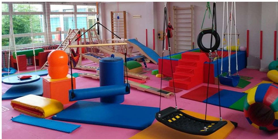
Slika 15: Kabinet za senzornu integraciju djece [31]